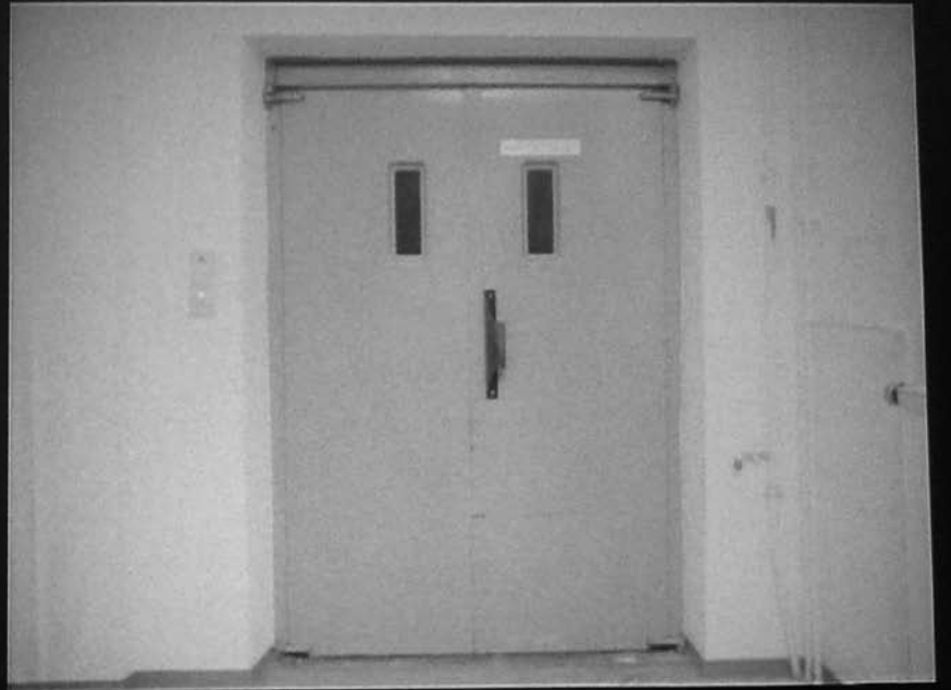
Pia Maria Martin, Für Olga, 16 mm Film, 2010